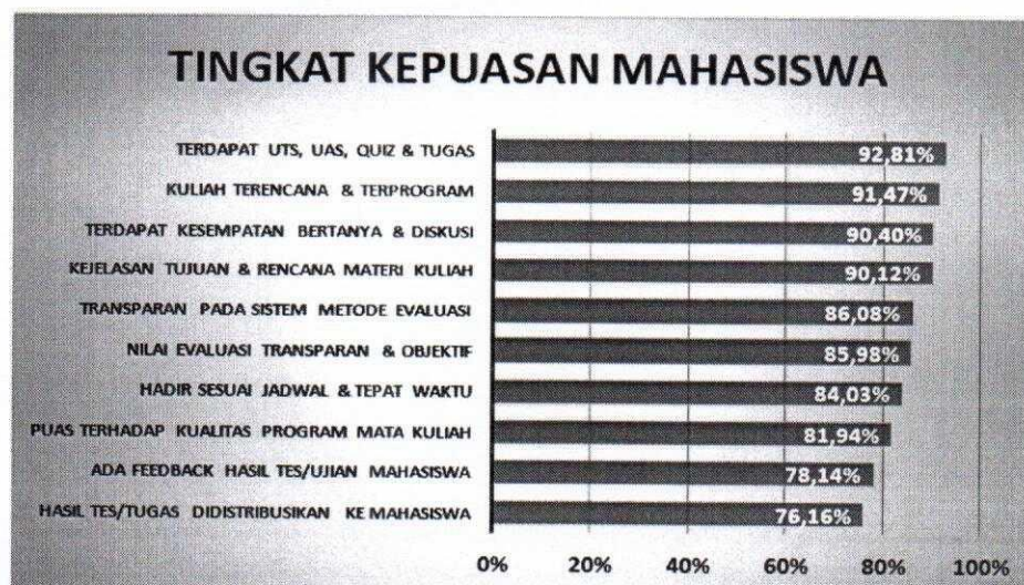
Tingkat Kesesuaian Kinerja Dosen Polman Bandung